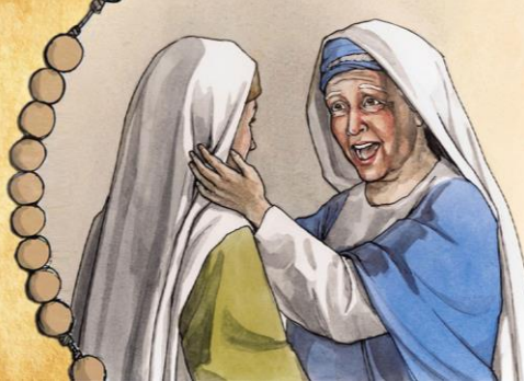
KI SI GA DEVICA V TEMPLJU NAŠLA