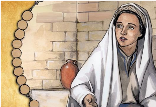
KI SI GA DEVICA V TEMPLJU DAROVALA