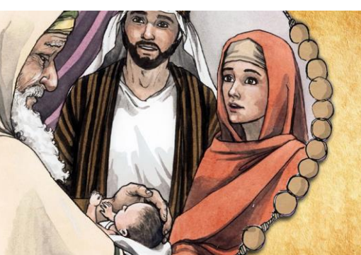
KI SI GA DEVICA RODILA