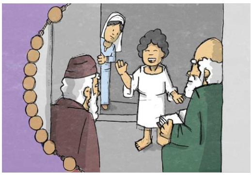
KI SI GA DEVICA OD SVETEGA DUHA SPOČELA