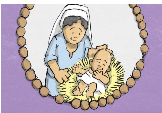
KI SI GA DEVICA V OBISKOVANJU ELIZABETE NOSILA