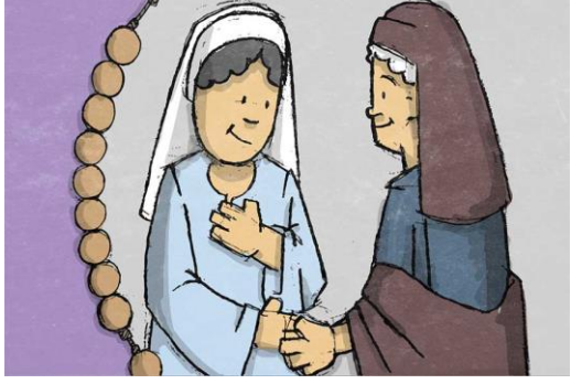
KI SI GA DEVICA V TEMPLJU NAŠLA