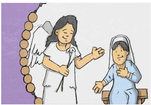
KI SI GA DEVICA V TEMPLJU DAROVALA