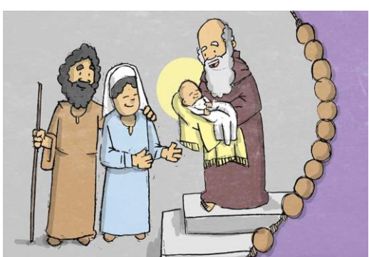
KI SI GA DEVICA RODILA