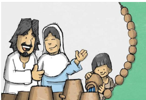
KI JE POSTAVIL SVETO EVHARISTIJO