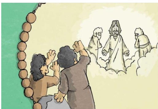
KI JE V KANI NAREDIL PRVI ČUDEŽ