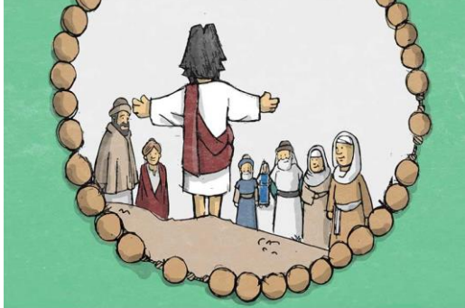
KI JE NA GORI RAZODEL SVOJE VELIČASTVO